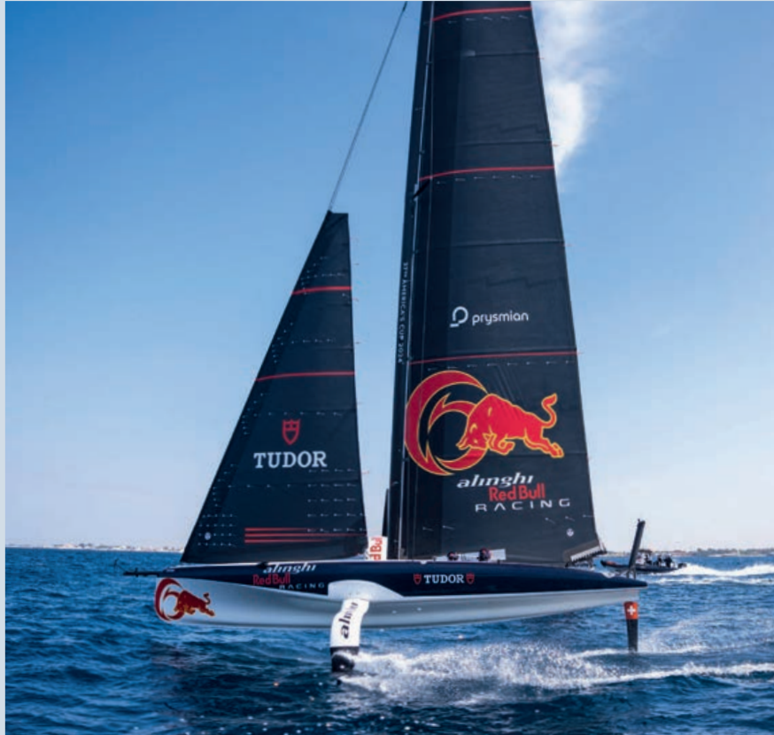
Alinghi Red Bull Racing kann mit bis zu 100 Km/h übers Wasser gleiten. - L'équipe d'Alinghi Red Bull Racing peut glisser sur l'eau jusqu'à une vitesse de 100 km/h

launchen. Das wird ein sehr spezieller Moment sein, denn dieses Boot soll uns zum Sieg führen. Also, es ist sehr viel am Gehen und das ganze Team arbeitet auf Hochtouren, denn die Tage, Stunden und Minuten werden jeden Tag wertvoller.« Tatsächlich ist die auf dem Namen «Boat One» getaufte Rennjacht ein Hightech-Gerät, das für die Formel 1 der Meere in Eclabens am Genfersee entwickelt und gebaut worden ist. Mit einer Rumpflänge von 20,7 Metern und einer Masthöhe von 26,5 Metern schafft die «Boat One» eine Wasserverdrängung von 6,2 Tonnen. Das Hauptsegel ist bis zu 145 Quadratmeter, das Vorsegel 90 m 2 gross, und wenn damit hart am Wind gesegelt wird und die Schweizer Rennjacht Geschwindigkeit aufnimmt, dann hebt sich der Rumpf aus dem Wasser und schießt auf seinen zwei gewölbten Tragflügeln, „foils“ genannt, über das Mittelmeer vor Barcelona. »Wir sind immer noch knapp vier Monate vom Rennstart entfernt, andererseits, wie gesagt, zählt schon jetzt jede Minute. Somit ist es wichtig, die Balance zwischen Anspannung und Erholung zu finden, um am Renntag in Topform zu sein und das machen wir sehr gut. Wir sind auf Kurs!«, erklärt der Schweizer Segler siegesgewiss.