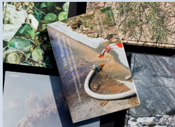
Das Wasserbuch. Überschwemmungen, Dürre, Gletscherschwund. Vier Expeditionen im Herzen Europas. Mathias Plüss, Regina Hügli, Echtzeit Verlag, 2022

Nähere Informationen zum Projekt und Folder zum Download unter www.sharing-water.net/workshops