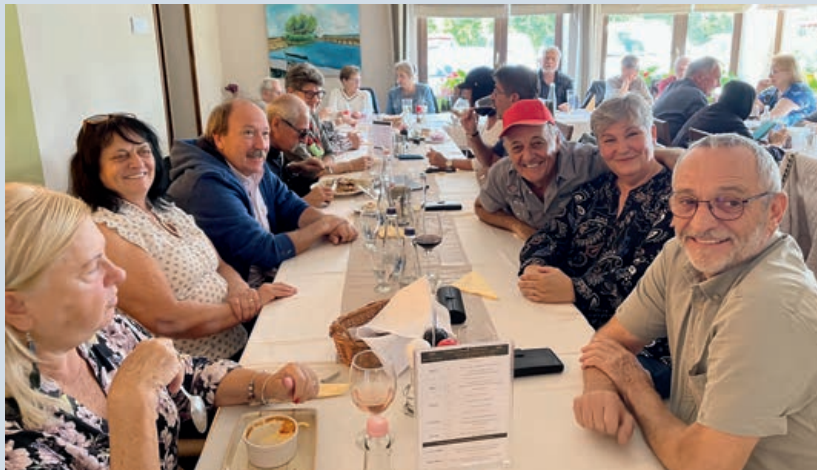
Gemütliches Treffen der Balaton-Schweizer.

Nach einer kurzen Einkehr im hauseigenen Café startete die interaktive Schokoladentour mit einer ausgezeichneten Führung am spektakulären Schokoladenbrunnen. Begleitet vom unwiderstehlichen Schokoladenduft machten sich die Vereinsmitglieder in zwei Gruppen auf eine sowohl historische als auch kulinarische Reise durch die Welt der Schokolade. Mit nur einem Schritt durch die Ticketschleuse fanden sich die Mitglieder im fernen Ghana wieder, wo sie den Kakaobauern bei ihrer Arbeit über die Schulter sehen durften. Danach ging es weiter nach Zentralamerika – wo die Geschichte der Schokolade vor Jahrtausenden begonnen hatte. Im darauffolgenden Raum erblickten die Vereinsmitglieder die wunderschöne Kulisse der Schweizer Alpen und erfuhren dort, wie die Schweiz durch Schweizer Pioniere zum ultimativen Schokoladenland wurde. Weiter ging es durch die Schokoladenproduktion und Forschungsanlage, wo die noch warme Schoko-