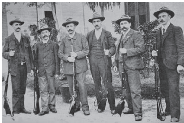
1903-Concurso de Tiro, un grupo de tiradores suizos visitó la Colonia San Jerónimo Norte