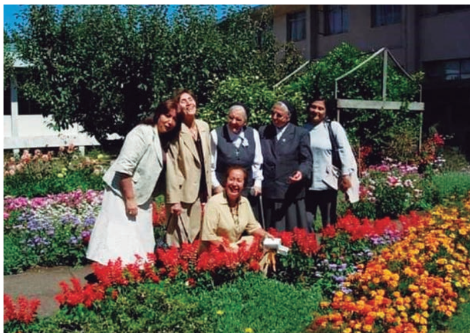
Grupo de laicos asociados a la Congregación, de Toltén y Hualpin