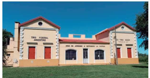
Tiro Federal Argentino-Ex Tiro Suizo

Con el paso del tiempo y conociendo la escases y las necesidades de la época, la institución comienza a te-