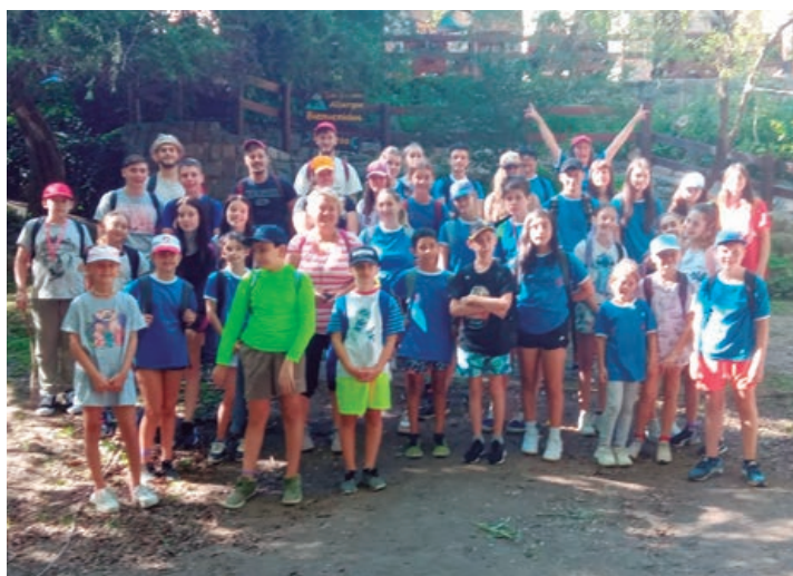
Niños y jóvenes protagonistas del Swiss Camp VII Edición