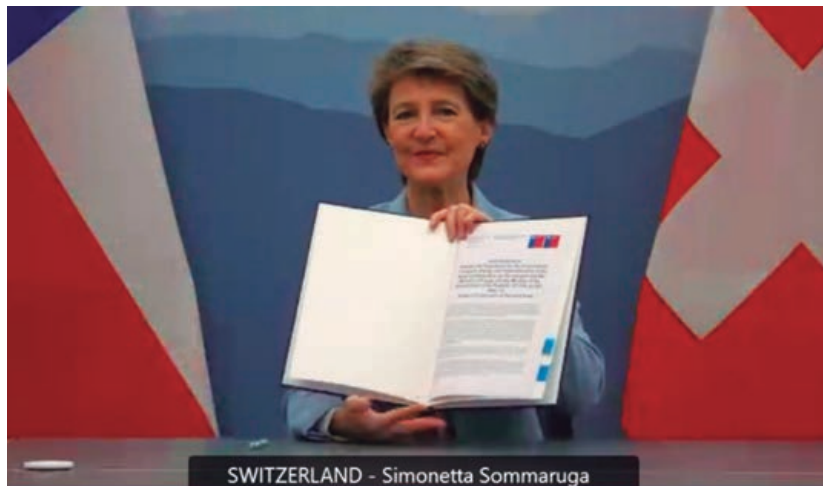
SWITZERLAND - Simonetta Sommaruga

Desde 2019, Suiza y Chile, a través de los Ministerios de