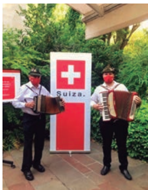
Recepción en Buenos Aires