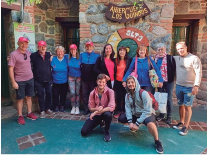
Voluntariado de FASRA