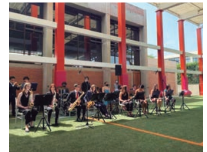
(EMBAJADA DE SUIZA-PERÚ)