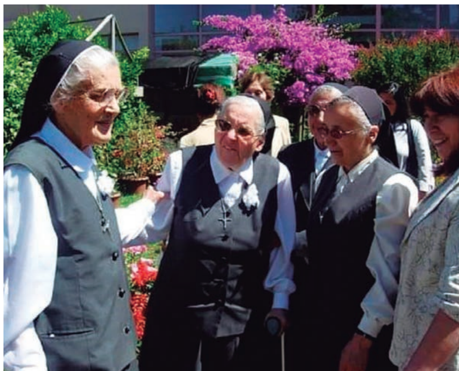
Celebración 60 años de profesión religiosa, Casa Provincial (2009)