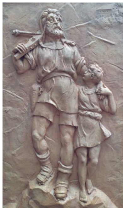
Guillermo Tell, obra del escultor suizo Johann Stutz

cargado de recortar la figura, entablarla, fijarla para que no se produjeran roturas y así se trasladó al nuevo espacio donde está actualmente.