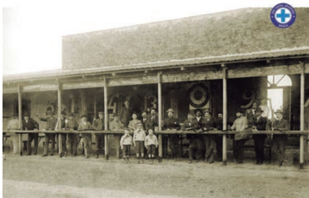
Primer concurso de tiro (1897)