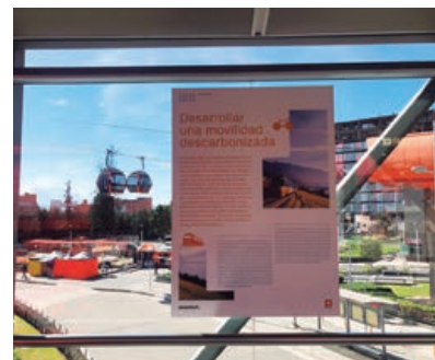
Paneles sobre la exposición en las pasarelas de Mi Teleférico