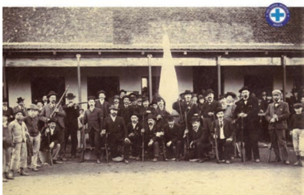
Una práctica dominical (Circa 1897)