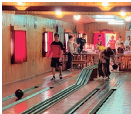
Recepción en Ruiz de Montoya-Misiones