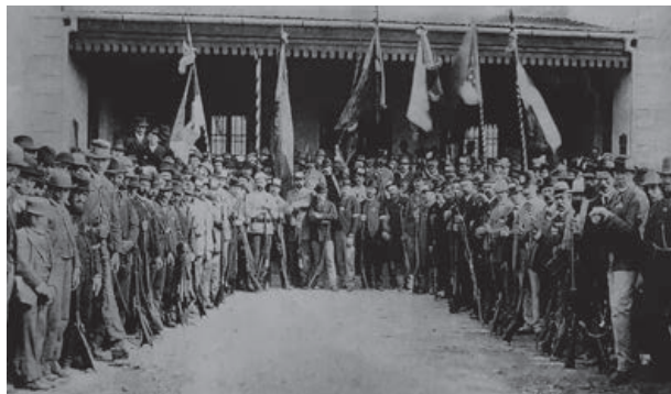
Stand de Tiro Suizo inaugurado el 08.09.1892