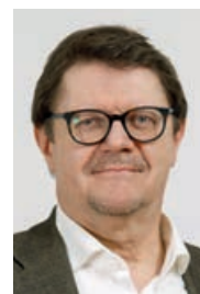
IVO DÜRR, REDAKTION