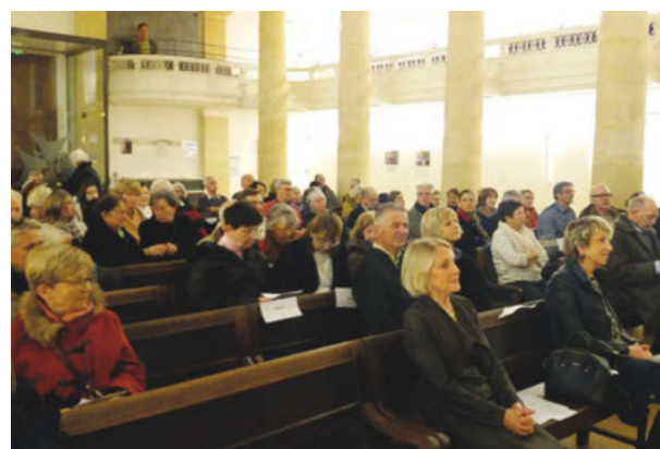
Concert de l'Avent 2016