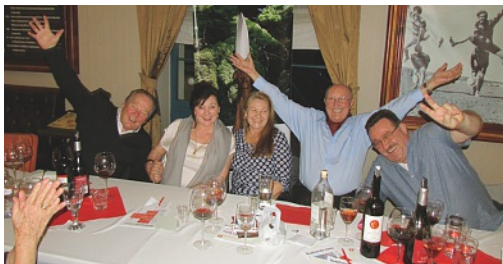
Schweizer kulinarischer Abend in Banská Štiavnica

Dieses Wochenende verbrachten 15 Mitglieder des Schweizerklubs zusammen mit dem Botschafter, Herrn Alexander Wittwer, in der historischen Stadt Banská Štiavnica in der Mittelslowakei. Die geladenen Gäste wurden im Hotel «Cosmopolitan» mit Spezialitäten aus verschiedenen Regionen der Schweiz verwöhnt. Eine slowakische Folkloregruppe in schönen Trachten bereicherte den Abend, anschliessend spielte eine Musikband zum Tanz auf. Erst spät am Abend (für einige Nachtschwärmer am frühen Morgen) ging dieser Anlass zu Ende.