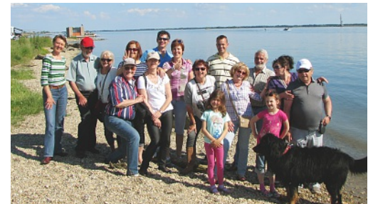
Ausflug in die Region der Beskyden in Ostmähren

Die sagenumwobene Region mit dem Berg «Tanečnica» und dem Denkmal des heidnischen