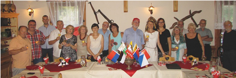
1. August-Feier in Podkylava/Region Myjava