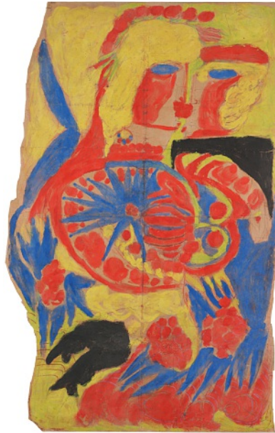
Aloïse Corbaz, Scène de baiser fleurie à la gouache, 1947, Bleistift und Gouache auf Papier, 120 x 75 cm.