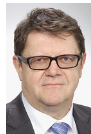
IVO DÜRR, REDAKTION

PS: Der Fehlerteufel hat in der letzten Regionalausgabe besonders heimtückisch zugeschlagen, indem ausgerechnet der Name unsers Botschafters in Wien, S.E. Christoph Bubb, falsch gedruckt wurde. Wir entschuldigen uns dafür!