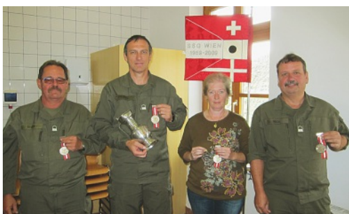
Siegerbild der Mannschaft des österreichischen Bundesheers