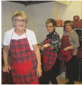
Unsere Wichtel bei der Arbeit

Eine besondere Freude war es, unter unseren Gästen Guardian und