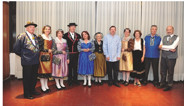
Asistentes al festejo con trajes típicos suizos

Todas las actividades propuestas resultaron muy motivadoras para los socios que participaron con entusiasmo. La Cena Aniversario se realizó en el Club que lució renovado, con un excelente menú de comida suiza y música en