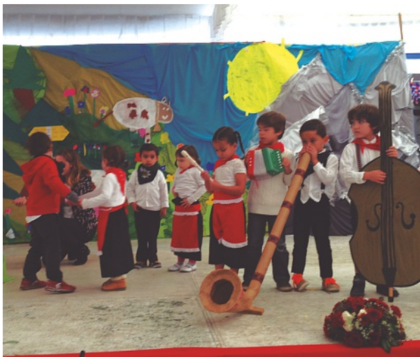
Actuación de los más pequeños del Colegio Suizo

personas, que disfrutaron de la celebración y después de un pic-nic en las instalaciones del Colegio.