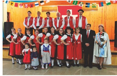
Ballet de la Asociación Helvetia de Línea Cuchilla, Embajador de Suiza, reina nacional del Folclore Suizo 2015

El Sr. Hans Peter Mock, Embajador de Suiza en Argentina, la reina nacional del Folclore Suizo 2015, autoridades locales, suizos de la Provincia de Misiones y el grupo de danzas suizas de la Asociación Helvetia de Línea Cuchilla.