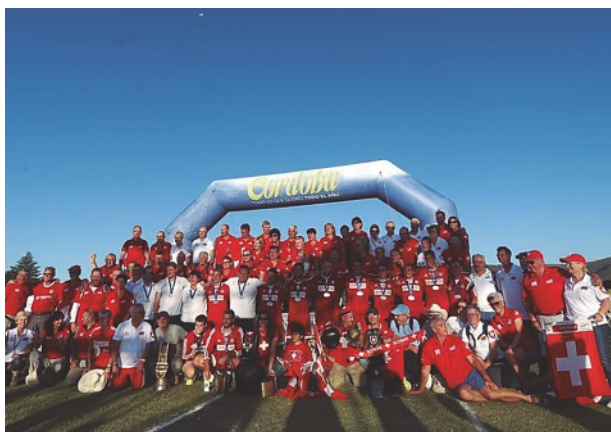
Suiza: medalla de plata

La exposición se inauguró en San Jerónimo Norte, Provincia de Santa Fe en el marco de la XXIV Fiesta Nacional del Folclore Suizo y realizó un largo viaje por distintas ciudades para que cientos de personas pudieran verla: Ciudad Autónoma de Buenos Aires, Rosario, Santa Fe, Rafaela, Esperanza, Paraná y Franck. El 30 de octubre la muestra fue inaugurada por el Presidente del Consejo Nacional del Parlamento de Suiza Sr. Stéphane Rossini, en el Museo Histórico Regional de la Colonia San José (Entre Ríos). Y seguirá su recorrido en el 2016.