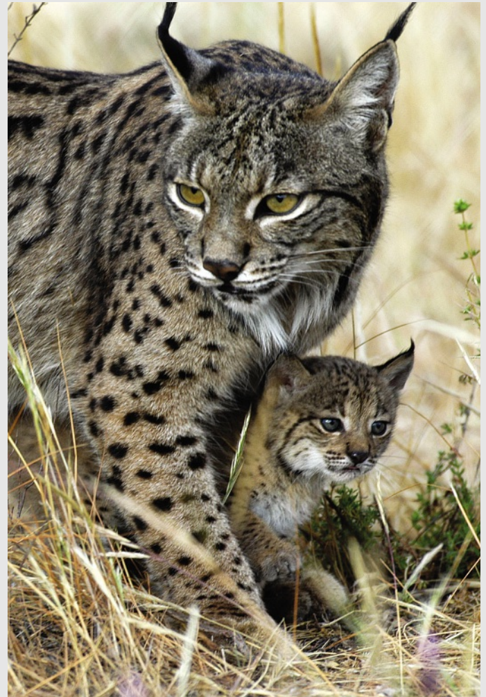
Der Iberische Luchs (Pardelluchs)