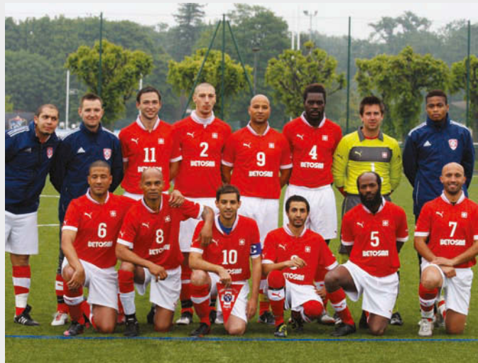
Equipe victorieuse de la coupe de Paris

La Coupe de Paris «Trophée Pierre de Salis» est à nous depuis le 9 juin 2013 grâce à la finale gagnée par 3 : 0 contre le FC Montigny-le-Bretonneux au stade du Camp des Loges du PSG à St-Germain-en-Laye. Ce match restera dans les annales du club qui courait après un tel succès depuis... 1955, année de la création de cette compétition par la Ligue de Paris et le concours d'un généreux sponsor et supporter des Suisses de Paris : le ministre Pierre de Salis. Après presque 60 saisons de participation et face à l'opposition d'une centaine d'équipes, les Suisses de Paris ont enfin récupéré ce trophée tant convoité. Toutes nos félicitations aux joueurs exemplaires de bout en bout de cette compétition. Vous avez fait honneur à l'image de marque de la Suisse par votre esprit conquérant et votre détermination. L'autre exploit marquant de la saison passée : la montée en DH – la division suprême de ce championnat – que notre club n'avait plus connue depuis... 30 ans ! Bonne chance !